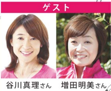
ゲスト 谷川真理さん 増田明美さん